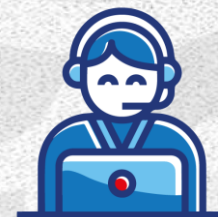
Facilitación de Trámites