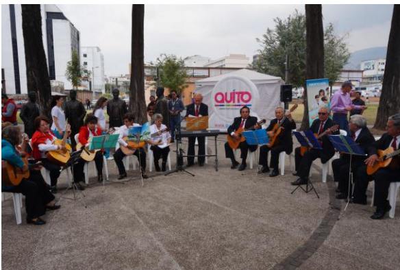
Homenaje por el día del adulto mayor