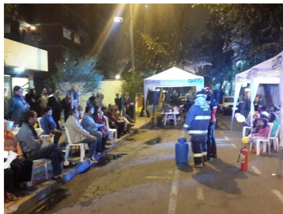
Encuentro Vecinal por la Paz