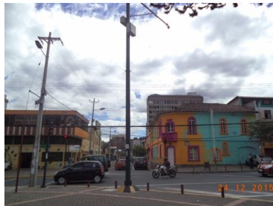
Colocación de cámaras de video vigilancia