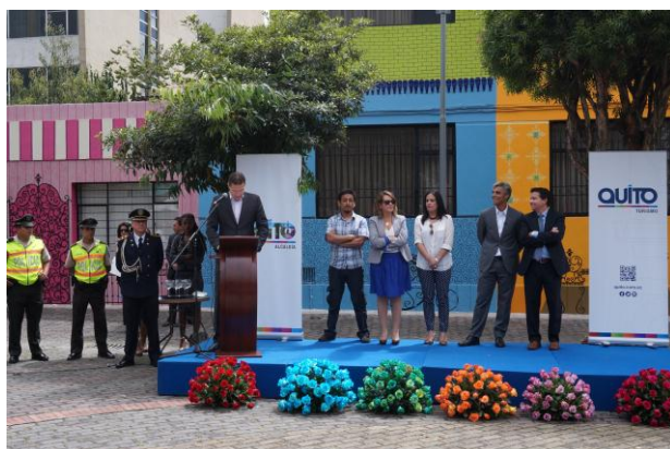
Intervención integral Plaza Borja Yerovi