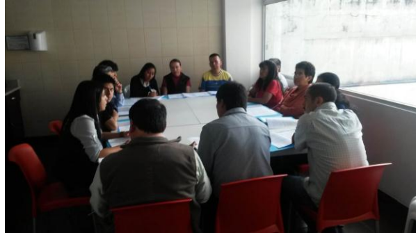
Socialización de Normativa técnica