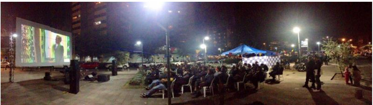
Proyecto Cine en La Mariscal