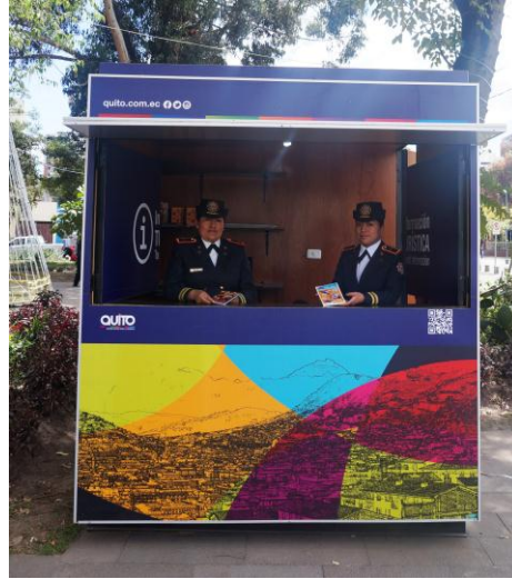
Nuevo Punto de Información Turística