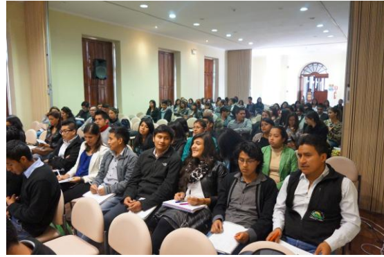
Seminario y Feria de Turismo