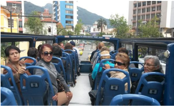
Recorrido en Quito Tour-Bus