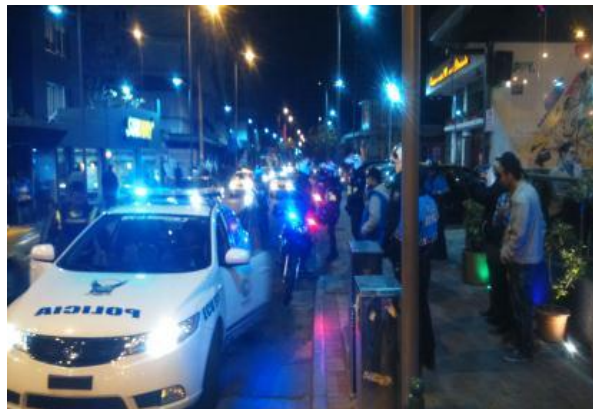
Operativos de Control