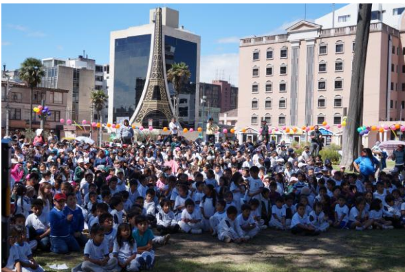
Evento Mi Placita de mil colores