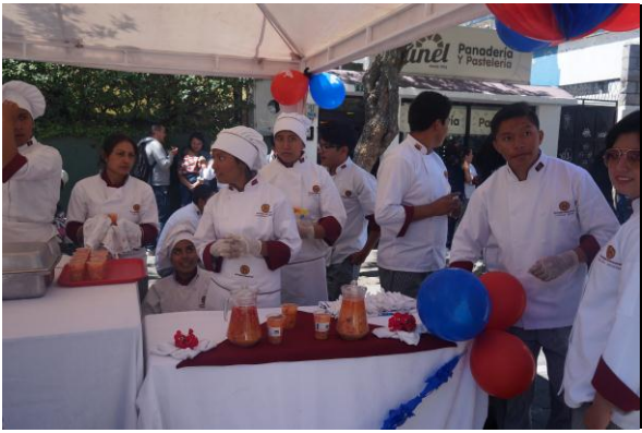
Feria Gastronómica La Mariscal