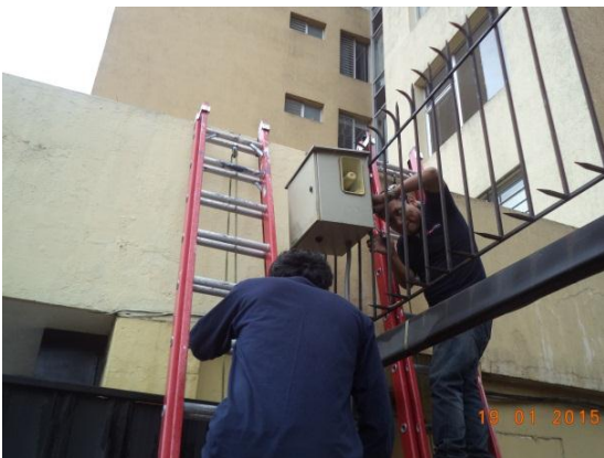
Reinstalación de Sistemas de Alarmas Comunitarias