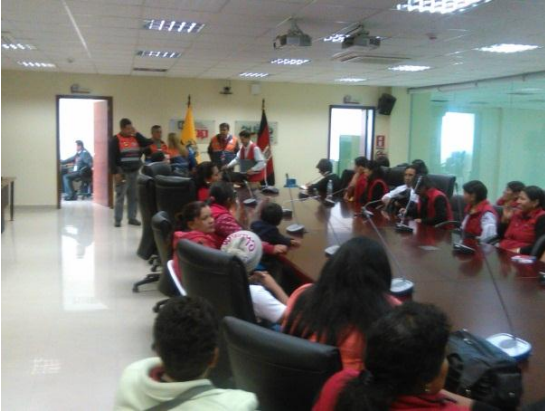
Capacitación manejo y buen uso de GLP