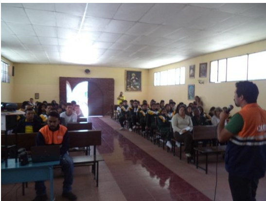
Sensibilización ante una eventual erupción del volcán Cotopaxi.