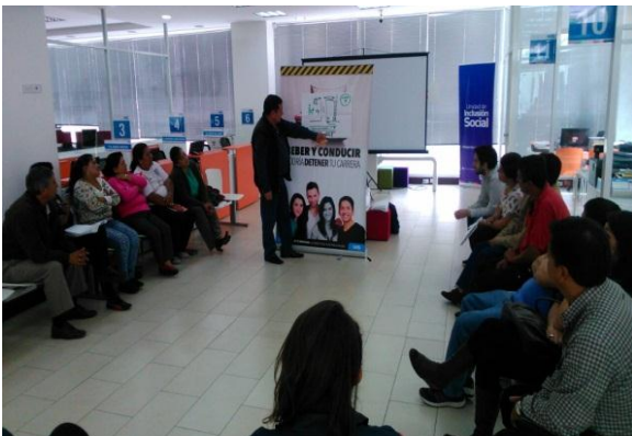
Escuela de Prevención y Convivencia Pacífica