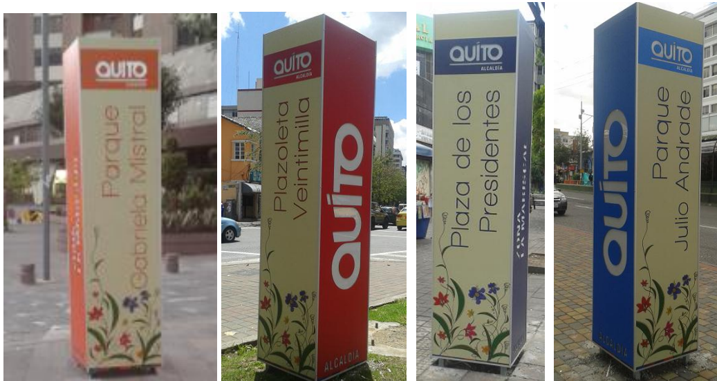
Rotulación de parques y plazas