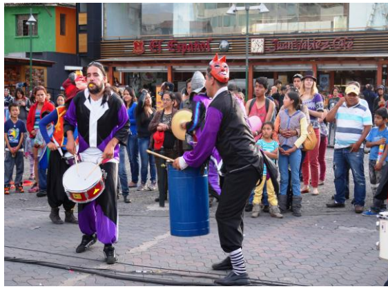
Evento Carnaval en la Mariscal