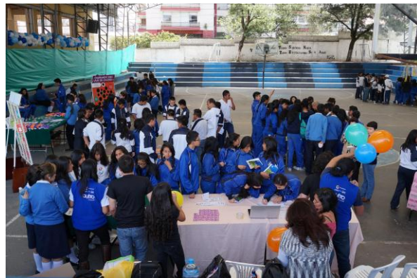
Feria Educativa Prevención de Riesgos en la Adolescencia