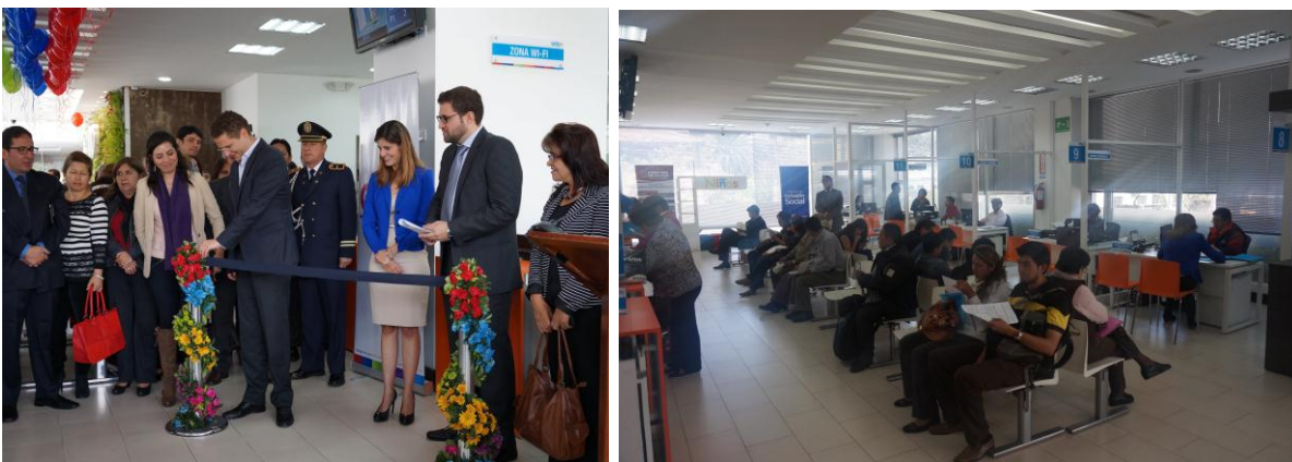
Implementación nuevo Balcón de Servicios