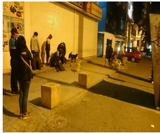
Intervención en situación de Mendicidad e Indigencia