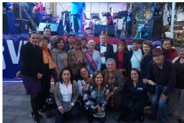
Elección de la Mariscaleña bonita