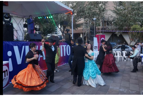
Elección Mariscaleña Bonita