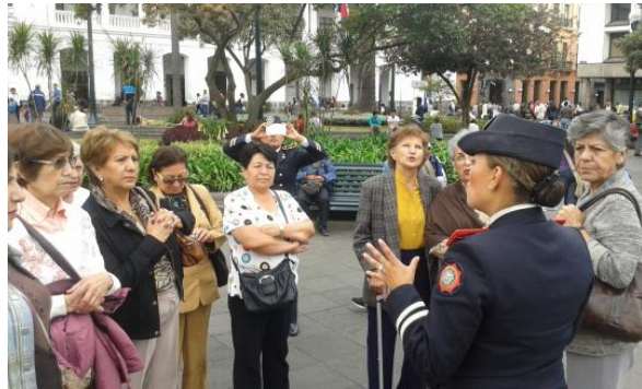
Recorrido al Centro Histórico