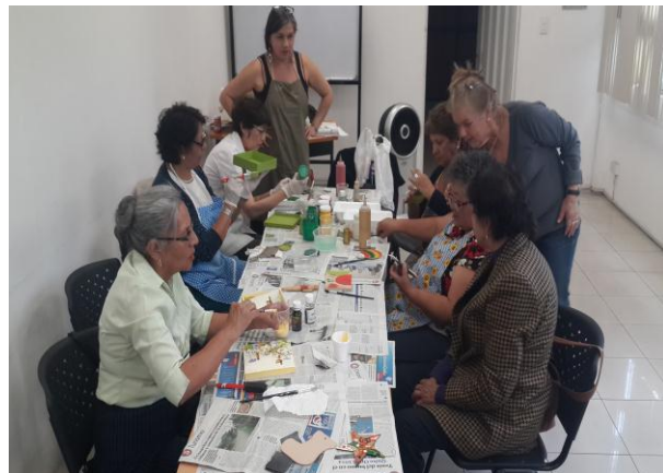
Taller de Arte terapia