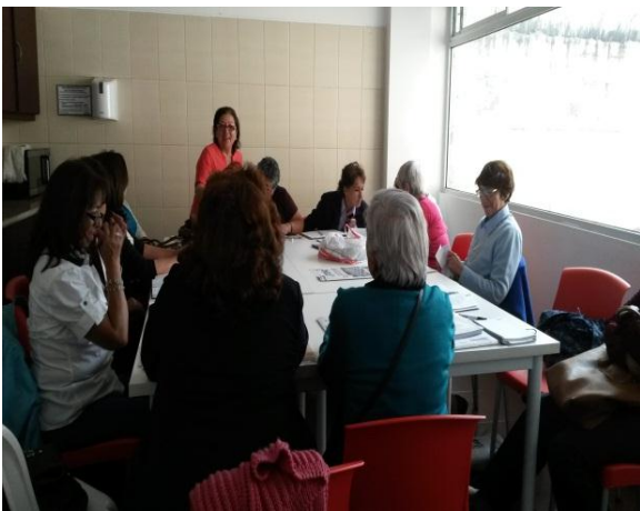
Taller de Salud Mental