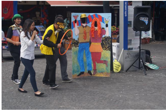
Campaña Tomate la vida sin riesgos