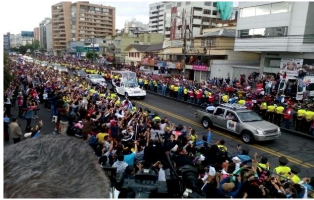
Operativo especial por la visita del Papa Francisco