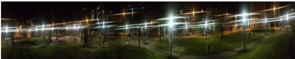
Iluminación Parque Julio Andrade