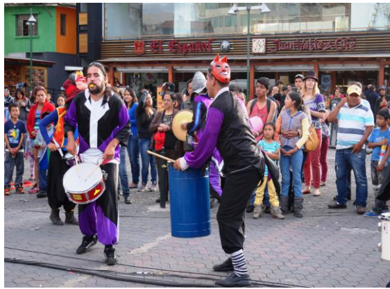
Evento Carnaval en la Mariscal