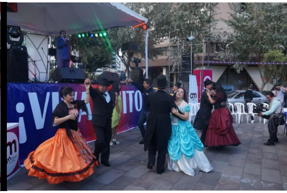
Elección Mariscaleña Bonita