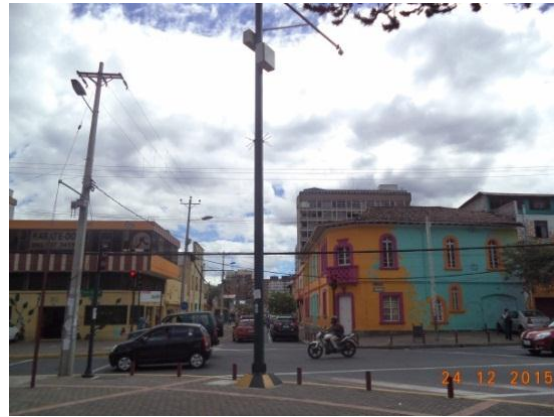
Colocación de cámaras de video vigilancia