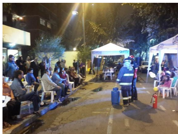
Encuentro Vecinal por la Paz