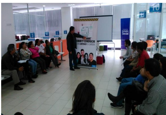
Escuela de Prevención y Convivencia Pacífica