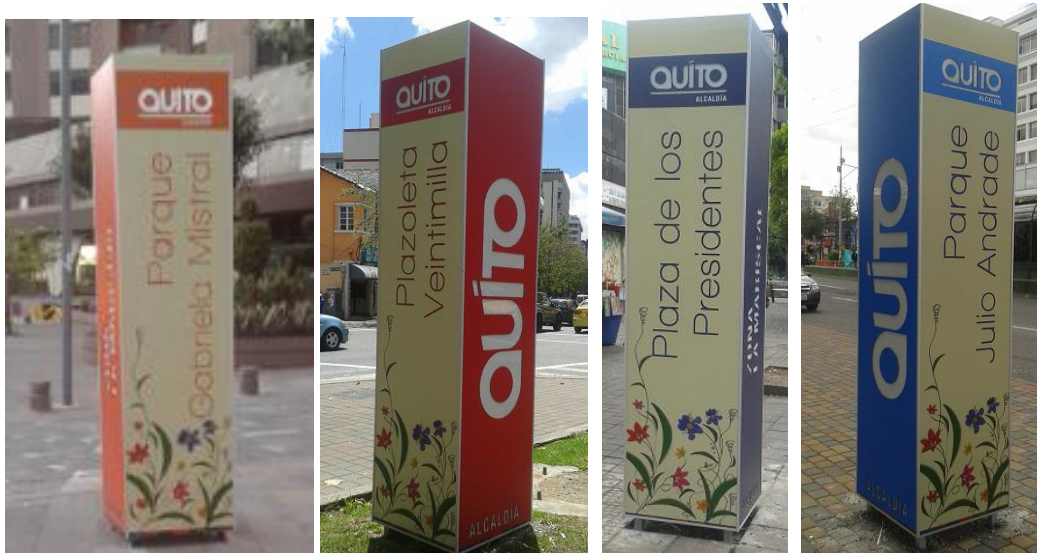
Rotulación de parques y plazas