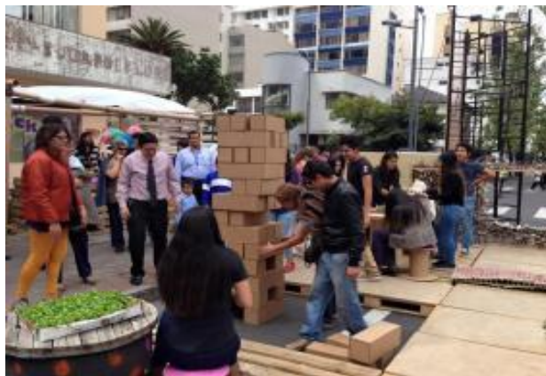
Peatonización y Pacificación