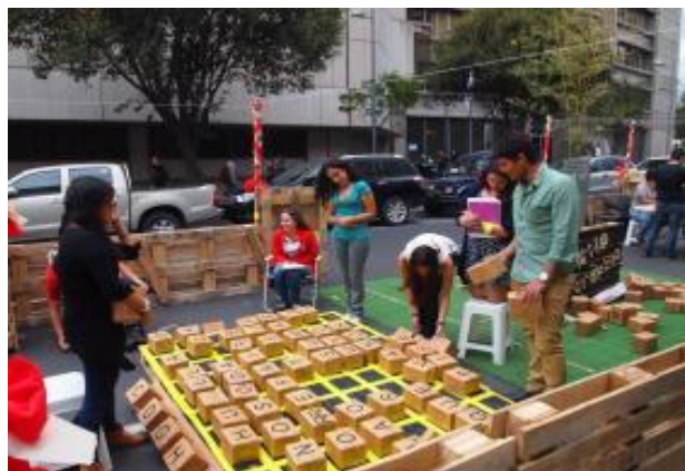
Peatonización y Pacificación