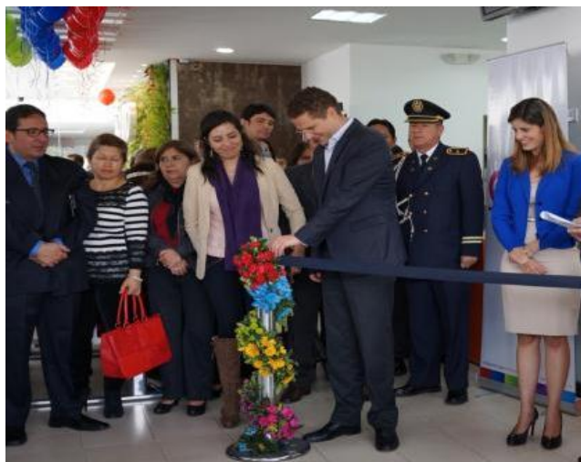
Inauguración Balcón de Servicios

Implementación del Balcón de Servicios de la Administración Especial Turística La Mariscal, considerado como un proyecto modelo, que con una imagen renovada brinda atención de primera calidad acorde a las necesidades del ciudadano.