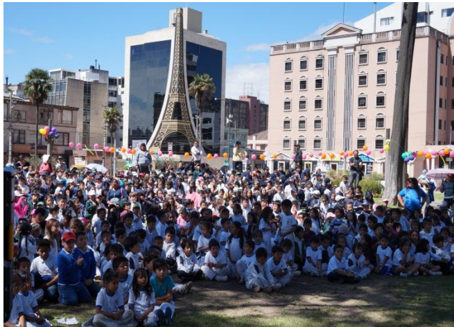
Fuente: AETLM Operativo de control fin de semana