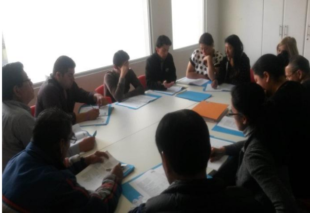
Socialización Normativa Técnica