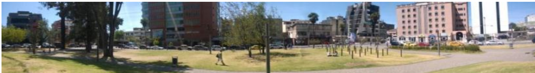
Parque Julio Andrade (foto diurna)