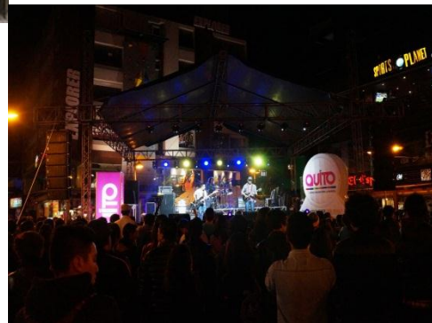
Concierto de Verano