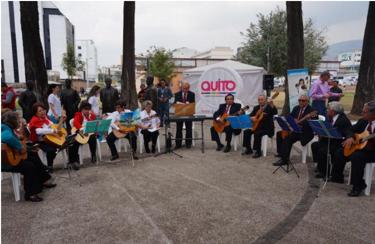
Día Internacional Adulto Mayor