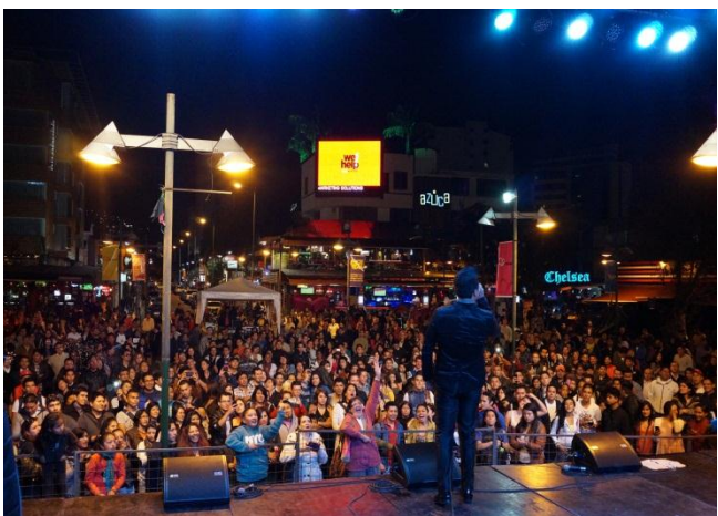
Evento de Carnaval