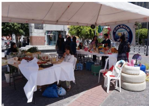
Feria de Reciclaje