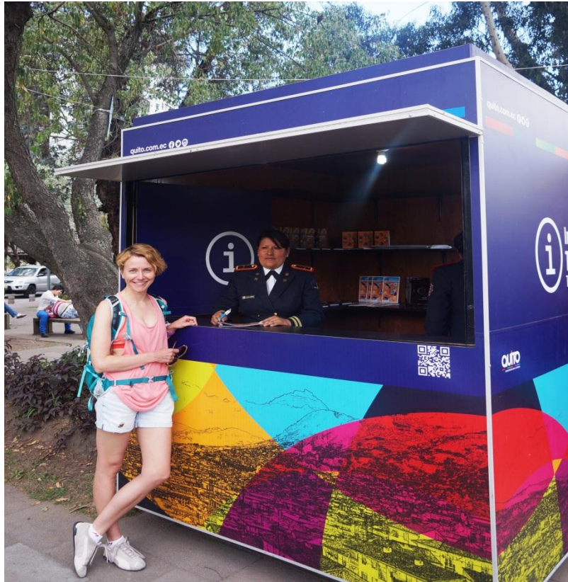
Punto turístico Parque Gabriela Mistral