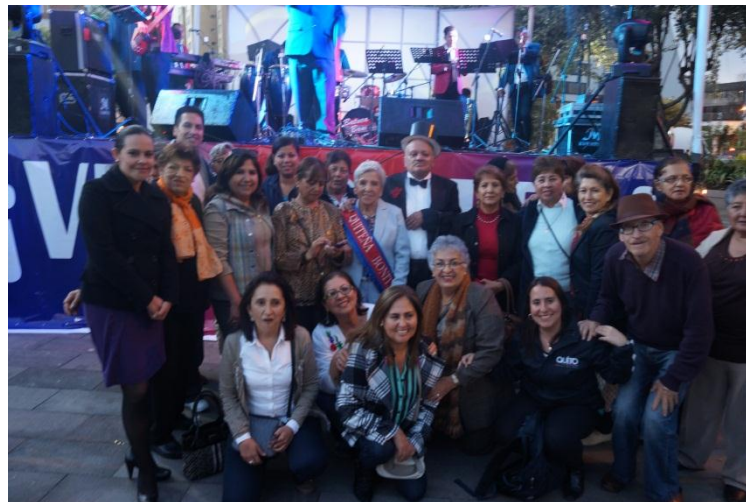
Elección Mariscaleña Bonita