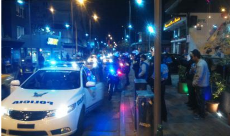
Operativo de control fin de semana