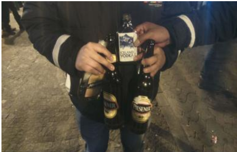
Operativo de control fin de semana